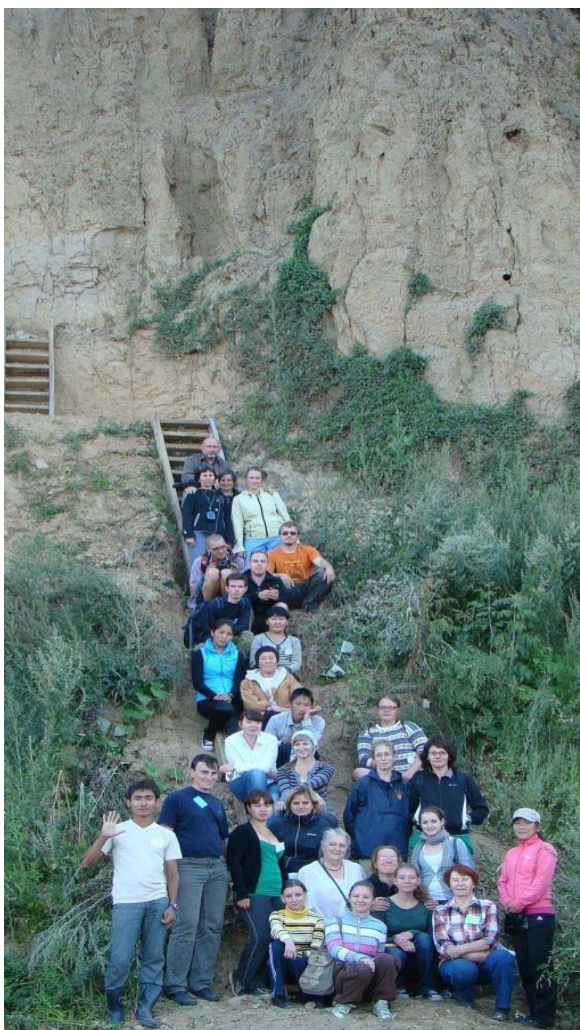
Фото 1. Участники второй Международной научной молодежной школы по палеопочвоведению в Сибири (2011 г.) на фоне разреза палеопочвы, в подошве которой З.Н. Гнибиденко выявлена граница Брюнес –Матуяма (к этому разрезу ведет лестница, на которой расположились участники школы).

проведения полевых мастер-классов в рамках работы школы; он удобен и как полигон для изучения разнообразных модельных ситуаций, созданных самой природой.