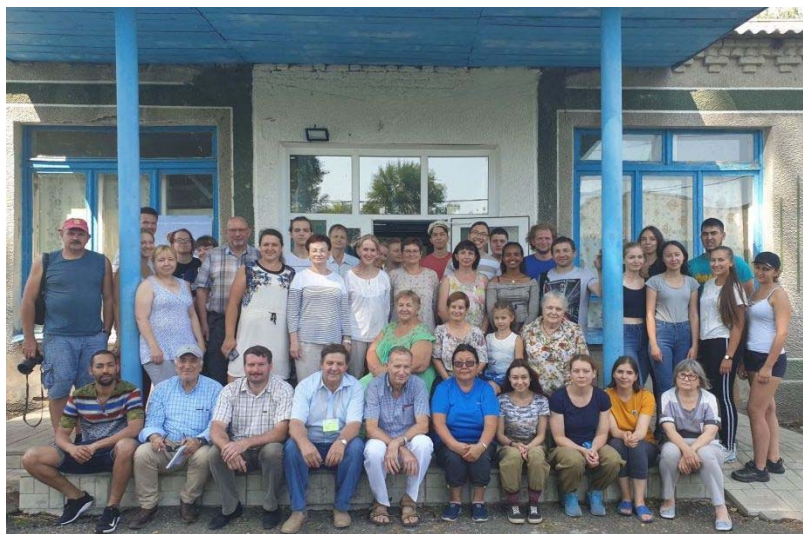
Фото 2. Участники заключительной юбилейной X Международной научной молодежной школы по палеопочвоведению в Сибири (2019 г.)

После окончания основной работы Школы, все участники отправились на традиционную постшкольную экскурсию в Горный Алтай на объект мировой значимости – Денисову пещеру, где были найдены кости человека, названного авторами находки Денисовцем.