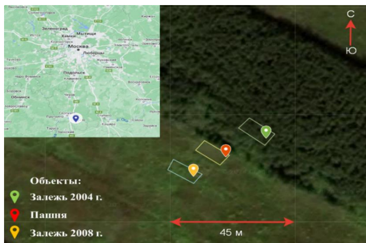
Рисунок 1. Расположение объектов исследования.

Исследования проводили на территории опытно-полевой станции Института физико-химических и биологических проблем почвоведения РАН (г. Пущино Московской обл., 54°49' с. ш.; 37°34' в. д.), на которой располагалась пахотная и постагрогенные экосистемы, выведенные из сельскохозяйственного оборота в 2004 и 2008 г. (рис. 1). По многолетним данным метеостанции комплексного фонового мониторинга п. Данки (Серпуховский р-н Московской обл.), среднегодовая температура воздуха \pm стандартная ошибка (SE) в 1991–2020 гг. в районе исследований составила 5,7 \pm 0,1 °С, а средняя многолетняя годовая сумма осадков ( \pm SE) – 640 \pm 20 мм. Температуры июля и января ( \pm SE) за этот же период составляют 18,8 \pm 0,3 и -7,2 \pm 0,6 °С, соответственно. Постоянный снежный покров в разные годы образуется в регионе, начиная с ноября до середины января, и держится, как правило, до середины апреля (Курганова и др., 2023).